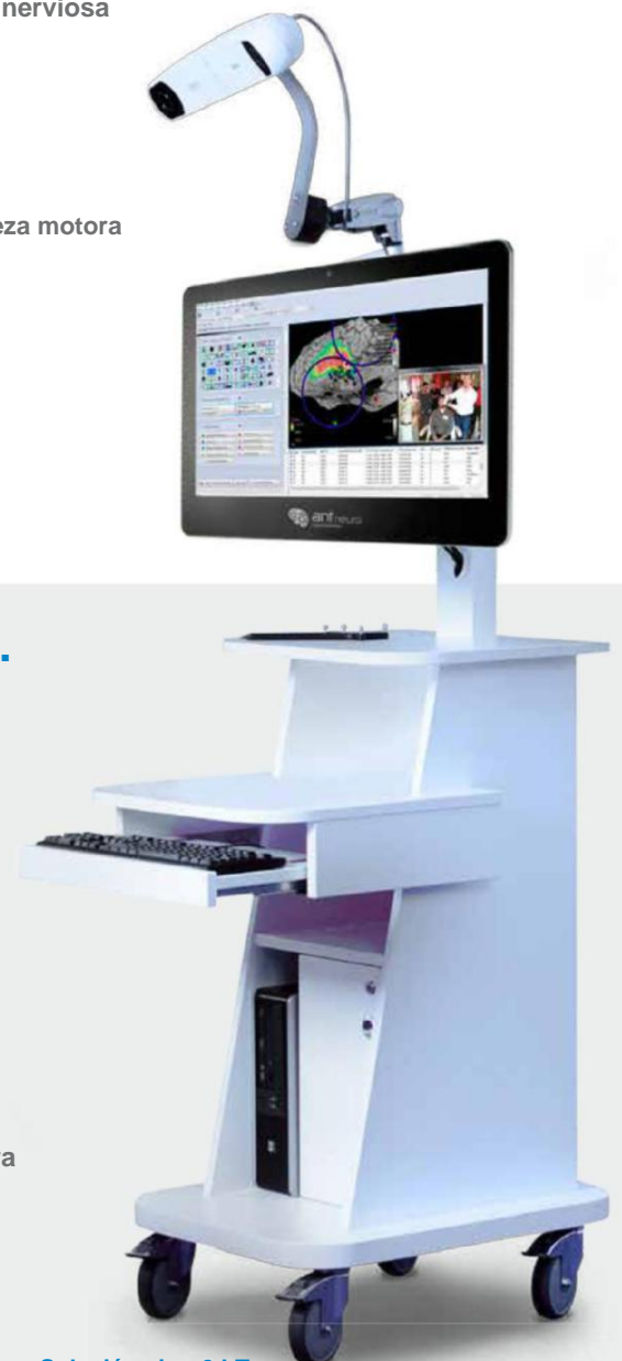
Solución visor2 LT

(La imagen puede contener objetos opcionales. El modelo actual puede variar)